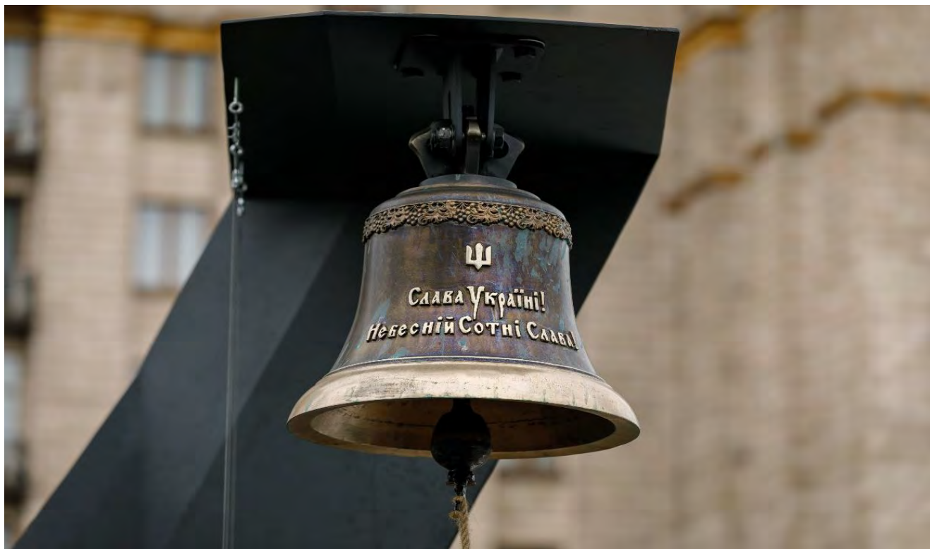
Дзвін Гідності на алеї Героїв Небесної Сотні у Києві.

Персональне вшанування кожного з Небесної Сотні є важливою практикою інституалізації суспільної пам'яті про події Революції Гідності, розширення загальнодоступних форм пошанування пам'яті загиблих, що слугує зокрема впровадженню в суспільстві моральних імперативів, гідних поваги та наслідування. Більше інформації за посиланням.