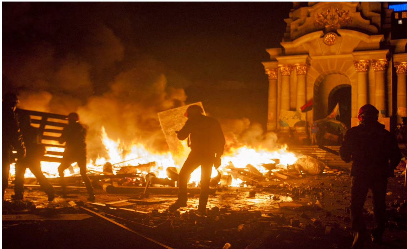
Ніч 19 лютого на майдані Незалежності.

О третій ночі барикаду на Хрещатику з боку Європейської площі було зруйновано, а від Будинку Федерації профспілок України до монумента Незалежності простягалася вогняна барикада.