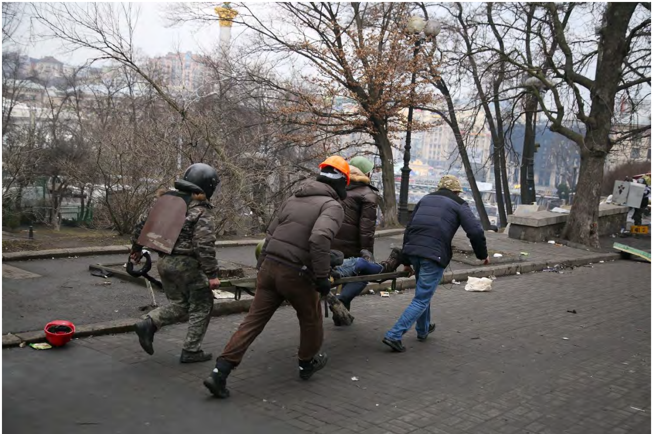
20 лютого 2014 р. Евакуація пораненого.