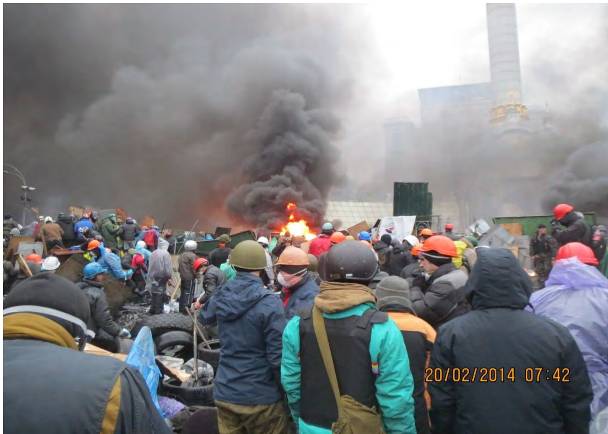
Майдан. Ранок 20 лютого на майдані Незалежності.

Ще в ніч на 19 лютого загін озброєних спецпризначенців передислокувався на автостоянку біля Міжнародного центру культури і мистецтв Федерації профспілок України (Жовтневий палац), де перебував у резерві до ранку 20 лютого 2014 року. Щоб позначати своїх, бійці загону поверх форменого одягу чорного кольору наклеїли на рукави скотч жовтого кольору, а для унеможливлення їх ідентифікації іншими особами одягнули під шоломи маски-балаклави. Це була рота спецпідрозділу “Беркут”, якою у день розстрілів командував Олег Янішевський.