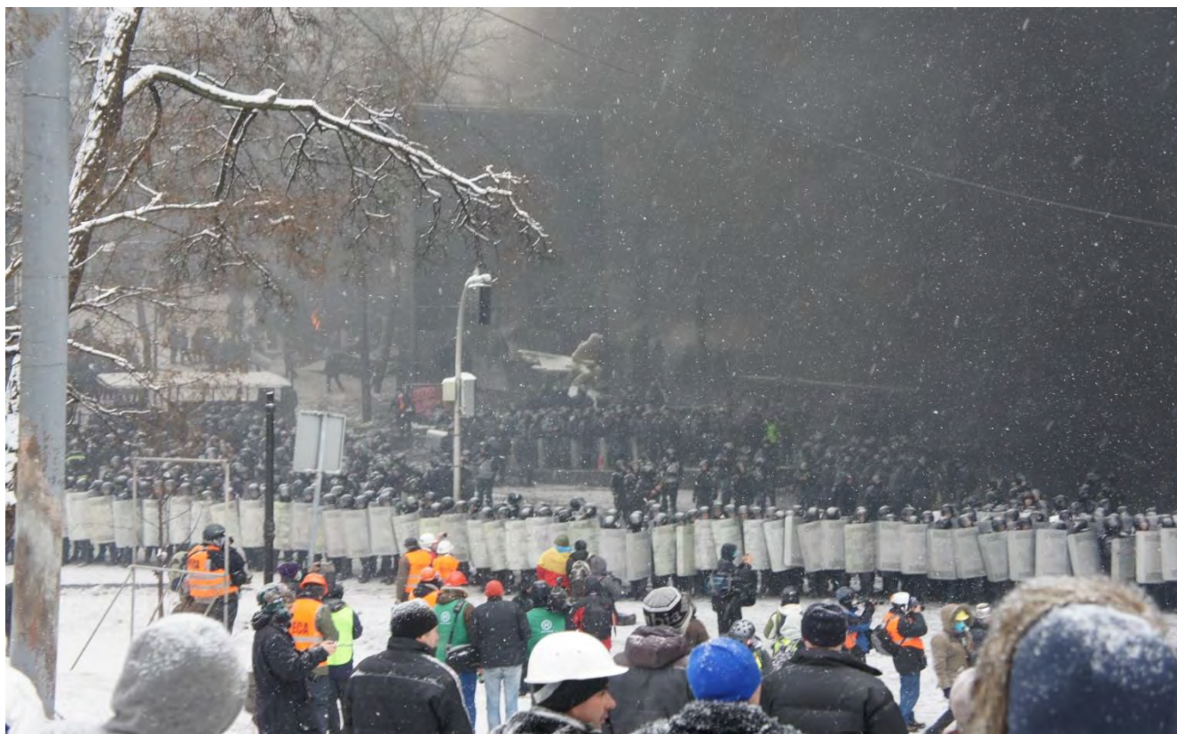
Вулиця Грушевського 22 січня 2014 року.

Саме в річницю проголошення незалежності Української Народної Республіки та День Соборності серед протестувальників з'явилися перші загиблі від вогнепальних поранень. Неподалік від колони стадіону “Динамо” в часовому проміжку між 05:30 і 05:40 вогнепальні поранення в шию, голову та груди отримав 20-річний вірменин Сергій Нігоян, майданівець із Дніпропетровської області. Мобільна бригада медиків перенесла активіста до медичного пункту, розташованого у вестибюлі будівлі Національної академії наук України на вулиці Михайла Грушевського, 4, та надала першу медичну допомогу. Однак уже за пів години лікарі констатували його загибель. Згодом до того ж самого медпункту було доставлено тіло ще одного важко пораненого – білоруса Михайла Жизневського, який отримав смертельне поранення у грудну клітку в часовому проміжку між 08:30 і 09:00 під час чергового штурму силовиків.