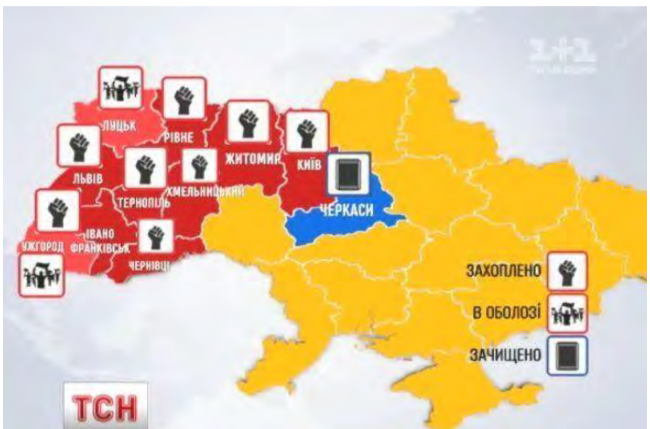
Карта України з позначенням міст, в яких активісти взяли під контроль будівлі державних адміністрацій, станом на 24 січня 2014 року.

На засіданні Штабу національного спротиву ухвалили рішення про активізацію Майданів у регіонах. Як наслідок, в областях України активісти почали збиратись у будівлях обласних державних адміністрацій, щоб не дати представникам влади можливість застосовувати силові методи. Станом на кінець дня 24 січня під контроль протестувальників було взято вісім облдержадміністрацій (разом із Київською міською державною адміністрацією, яку мітингарі контролювали ще від 1 грудня 2013 року): Івано-Франківську, Чернівецьку, Тернопільську, Рівненську, Львівську, Хмельницьку ОДА, Житомирську МДА. У Луцьку й Ужгороді активісти оточили будівлі адміністрацій. У Черкасах силовикам удалося відбити у мітингувальників приміщення раніше захопленої адміністрації.