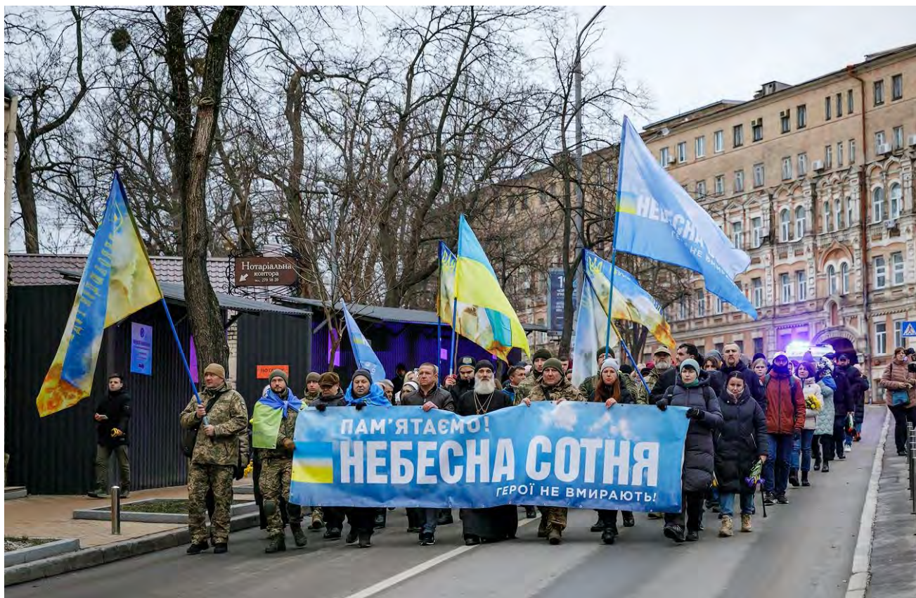
Щорічна хода пам'яті.