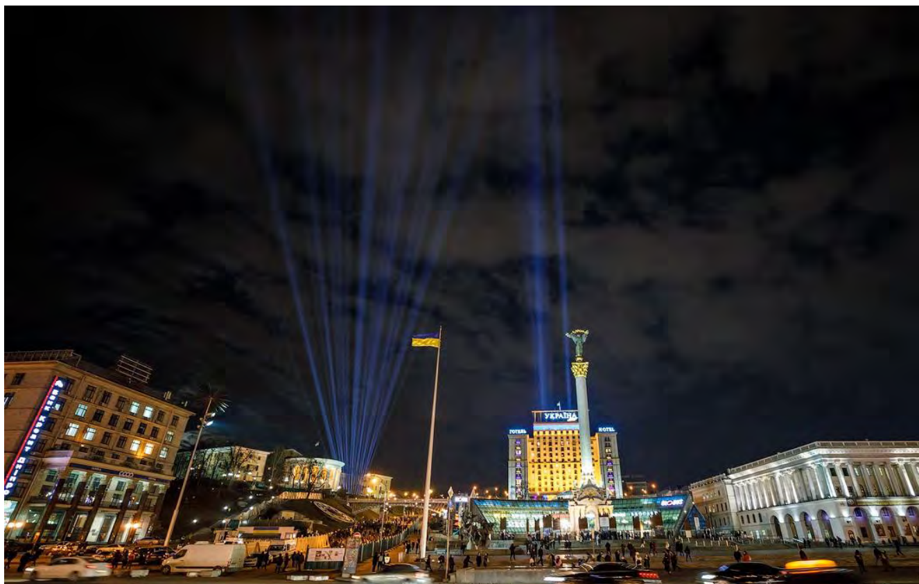
Промені Гідності.

До другої річниці створення Музею, 18 листопада 2017 року, світлову інсталяцію розмістили на місці майбутнього меморіально-музейного комплексу. До початку широкомасштабного вторгнення росії в Україну щороку 20 лютого під час відзначення Дня Героїв Небесної Сотні на знак пам'яті про загиблих учасників Революції Гідності на алеї Героїв Небесної Сотні Музей запалював 107 променів. Під час режиму воєнного стану з огляду на безпекові заходи промені не запалюють.