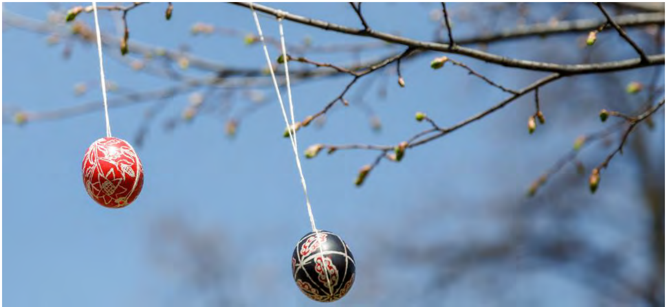
Великодні символи на алеї Героїв Небесної Сотні.

Акцію “Різдво для Героя” було ініційовано родинами Героїв Небесної Сотні. У межах заходу для вшанування загиблих до пам’ятних місць кладуть різдвяні вінки, сплетені напередодні.