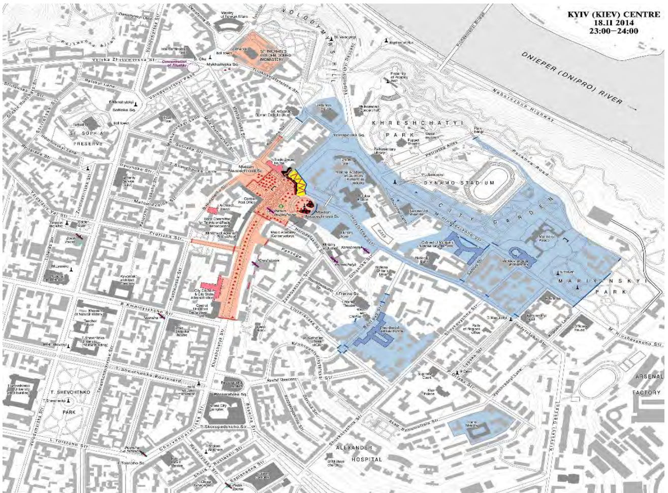
Карта середмістя Києва з розстановкою сил станом на 23:00 18 лютого 2014 року. Рожевим кольором позначено територію Майдану, блакитним – розташування силовиків, чорним – вогняні барикади та намети. Автор карти Дмитро Вортман.