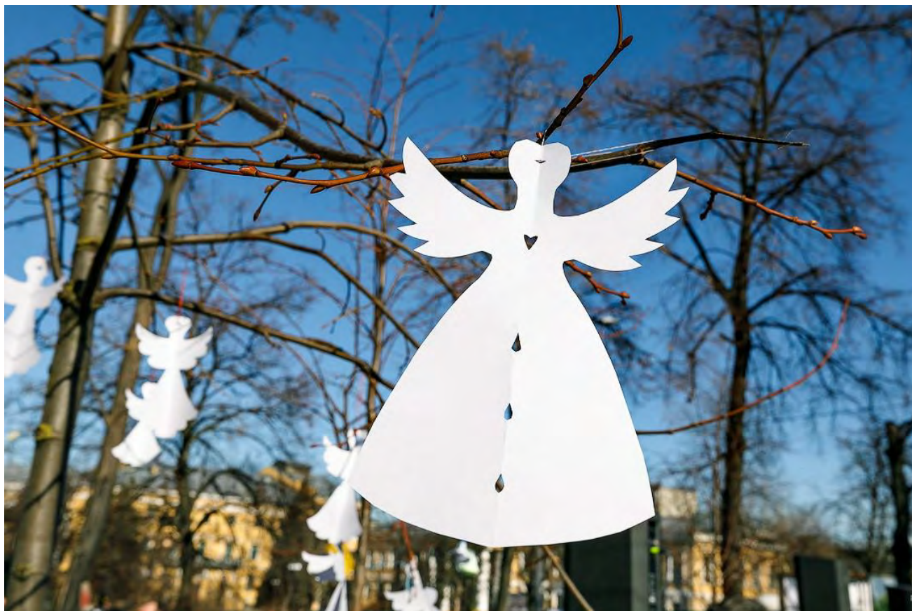
Ангели на алеї героїв Небесної Сотні.