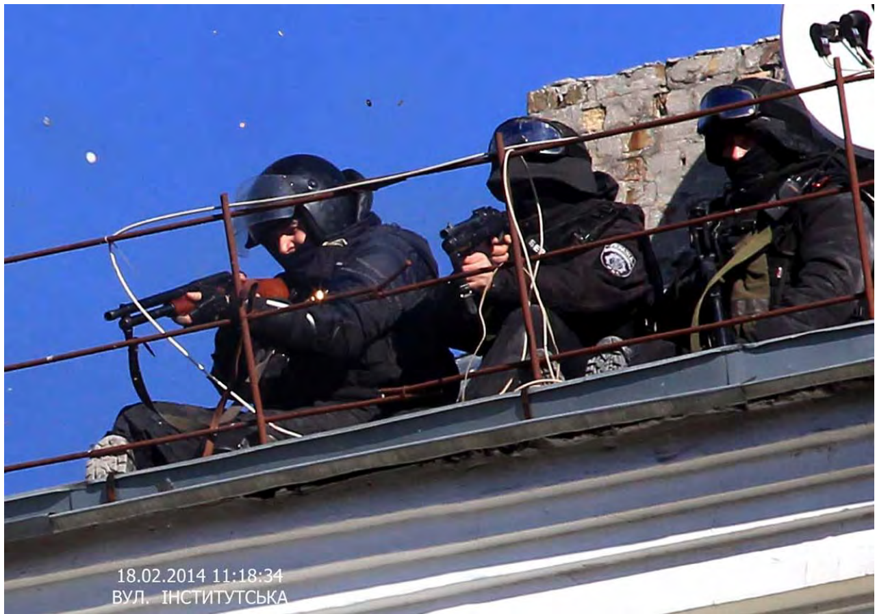
Силовики на дахах урядового кварталу ціляться в учасників «мирного наступу».