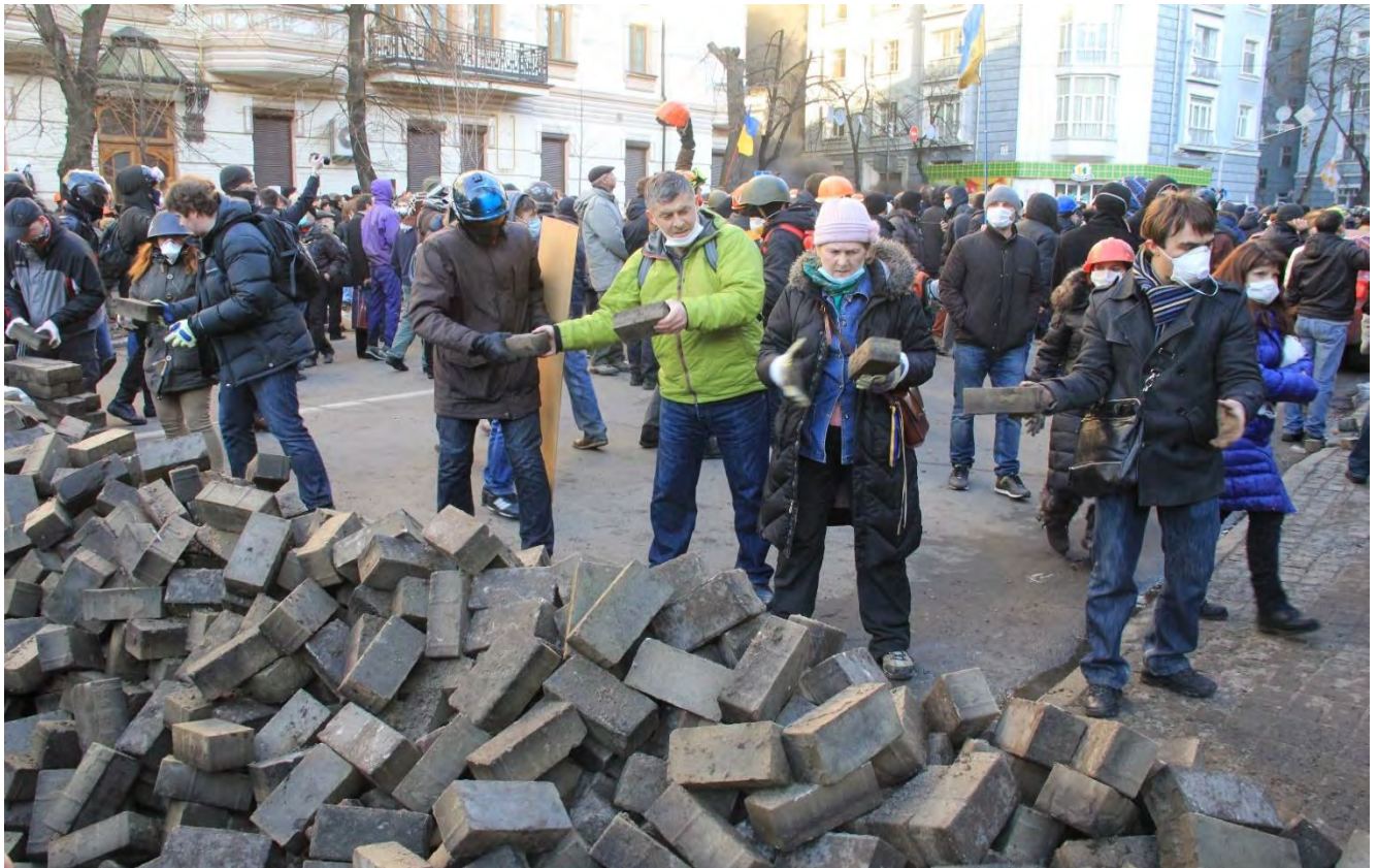
Зведення барикад на вул. Інститутській 18 лютого.

О 16:03 СБУ та МВС висунули опозиції ультиматум – припинити протистояння та звільнити Майдан до 18:00.